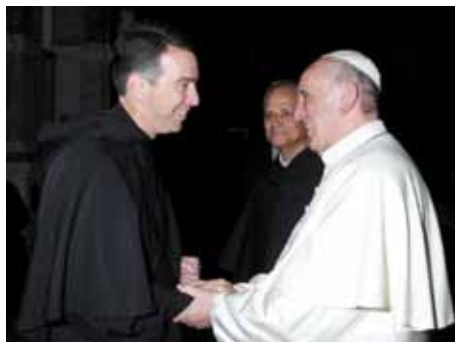
In gesprek met Paus Franciscus (2013).

Paus Franciscus biedt de Kerk, algemeen gesproken, een persoonlijk