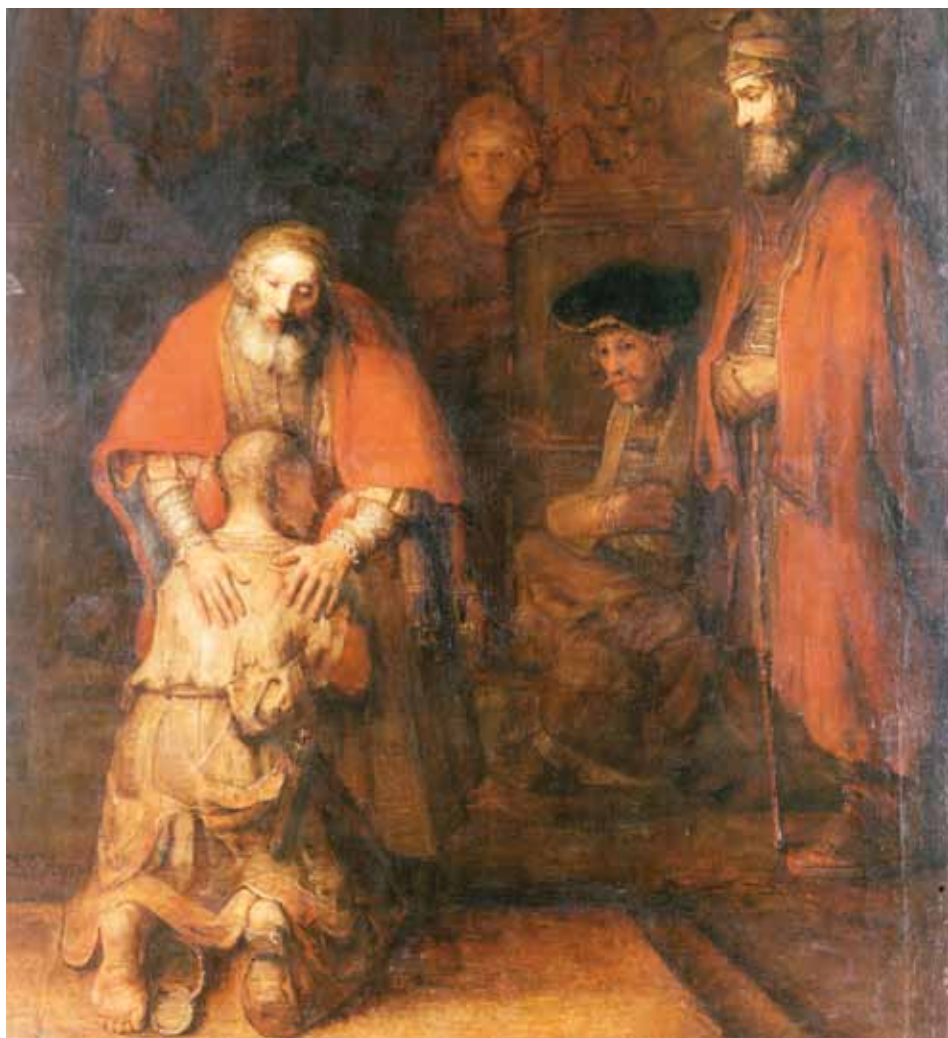
Rembrandt, terugkeer van de verloren zoon, 1668

Het kruis van Christus gebruikt Augustinus als beeld om de breedte, hoogte, lengte en diepte van zijn liefde voor ons aan te geven. De diepte is dat deel van het hout dat verborgen is in de grond maar zonder welke het kruis niet kan staan. Die diepte noemt Augustinus sacramentum : dit is de plaats van waaruit de genade naar ons toekomt, kosteloos. (s. 165,3) Een gelovige volgt Christus' kruis na met